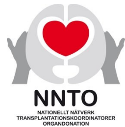
Figur 4 logga NNTO

* NNTO - Nationellt Nätverk Transplantationskoordinatorer Organdonation, är ett nätverk inom Svensk Sjuksköterskeförening, SSF. I nätverket samlas alla Sveriges transplantationskoordinatorer som arbetar med organdonation från avlidna givare.